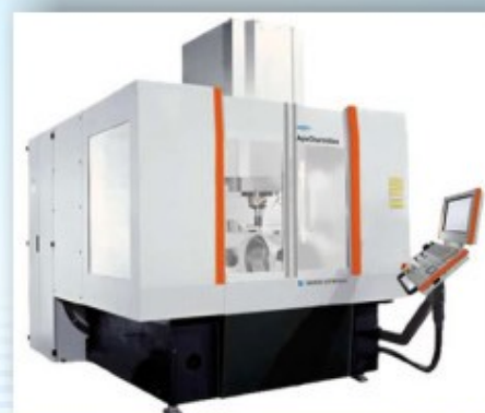
Micron GF VCP 800W Duro