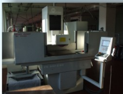
Brúska GEIBEL HOTZ GmbH FS 640 Z SD