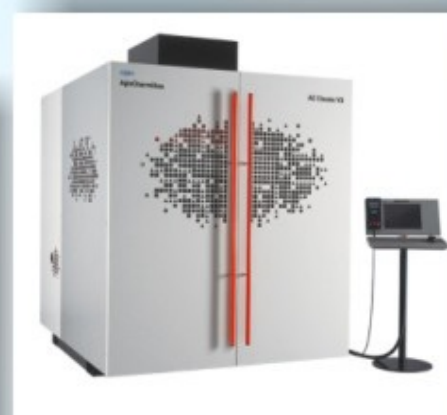
AgieCharmilles AC Classic V3