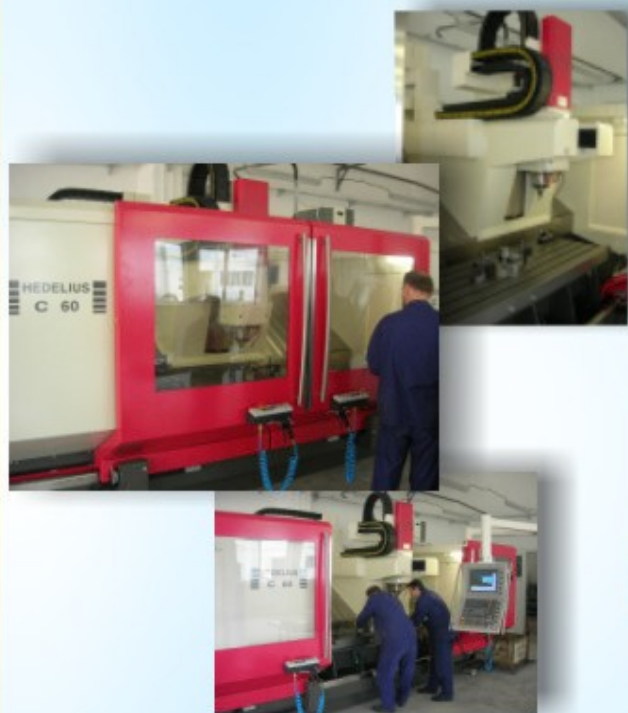
Obrábacie centrum HEDELIUS C 60