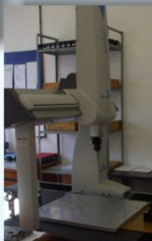
3D meraci prístroj DEA GLOBAL CLASSIC