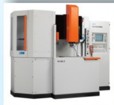
FO350S 3 4